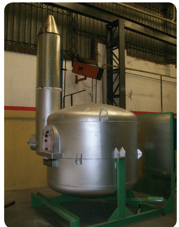
Epígrafe de foto.