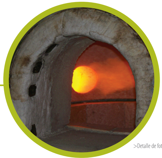
>Detalle de foto

Todo el sistema de combustión de cada horno de la línea FV está construido para poder efectuar el calentamiento desde temperatura ambiente a temperatura de fusión en modo automático, siguiendo un programa de salida de temperatura.