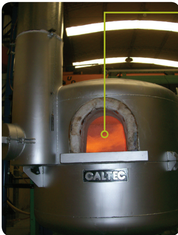
Epígrafe de foto.